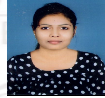
Photo and Signature